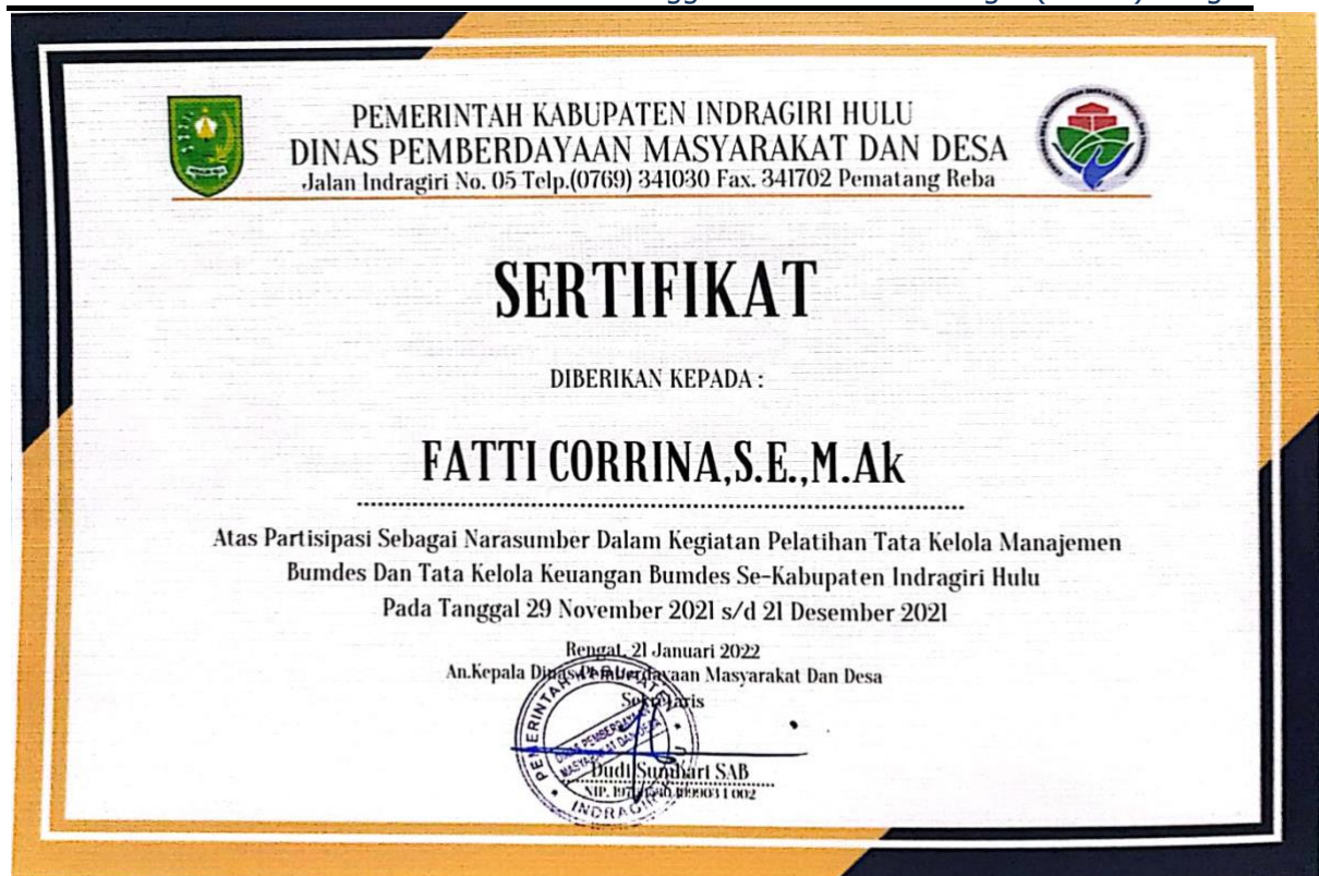
Gambar 4 : Sertifikat Narasumber dari Dinas PMD