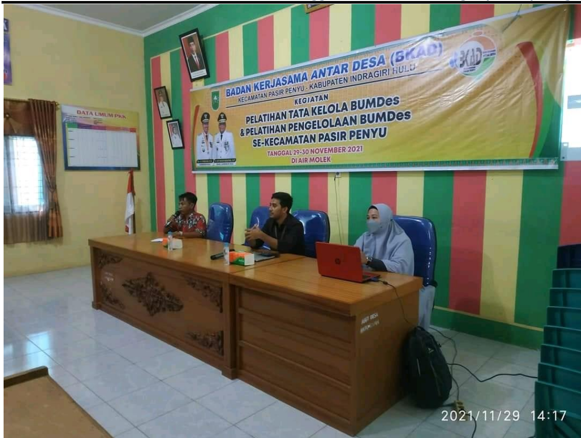
Gambar 3 : Dokumentasi Kegiatan