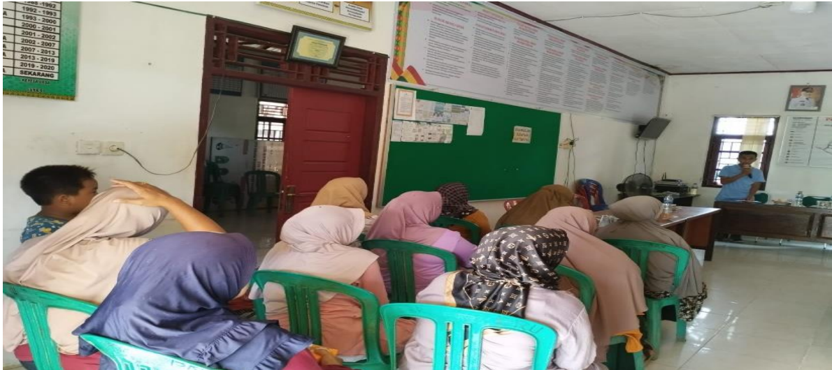
Gambar 1. Kata Smbutan dari Perangkat Desa Baturijal Hulu Kecamatan Peranap