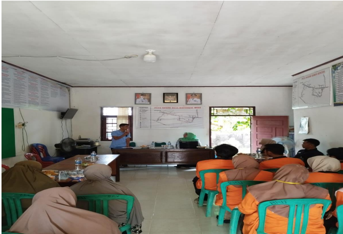
Gambar 3. Diskusi dan Tanya jawab Peserta Sosialisasi Meningkatkan Daya Saing Dan Peluang Kewirausahaan Serta Pemanfaatan Pemasaran Digital