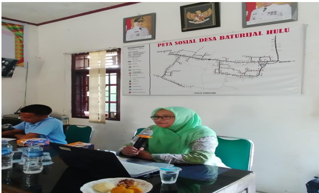
Gambar 2. Presentasi oleh Narasumber Dosen ITB Indragiri