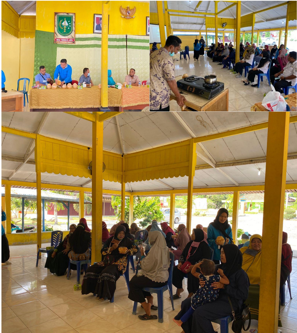
Gambar 2. Kegiatan Acara Sosialisasi