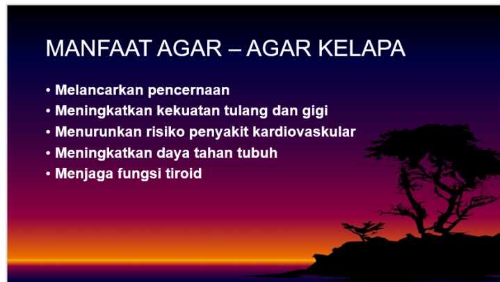
Gambar 1. Slide Presentasi

Pendapatan masyarakat adalah penerimaan dari gaji atau balas jasa dari hasil usaha yang diperoleh individu atau kelompok rumah tangga dalam satu bulan dan digunakan untuk memenuhi kebutuhan sehari-hari. Sedangkan pendapatan dari usaha sampingan adalah pendapatan tambahan yang merupakan penerimaan lain dari luar aktifitas pokok atau pekerjaan pokok. Pendapatan sampingan yang diperoleh secara langsung dapat digunakan untuk menunjang atau menambah pendapatan pokok. (Reksoprayitno, 2004)