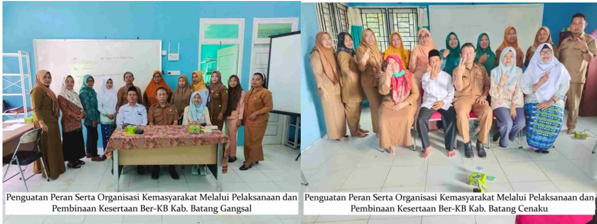
Gambar 1. Dokumentasi Kegiatan Sosialisasi