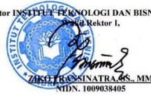
Gambar 3. Surat Balasan dari Institut Teknologi dan Bisnis Indragiri Mengenai Narasumber

An. Rektor INSTITUT TEKNOLOGI DAN BISNIS INDRAGIRI Kepala Rektor I,