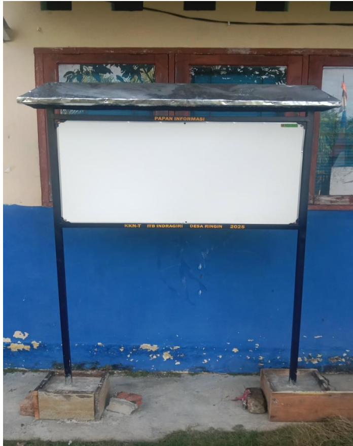
Gambar 4. Papan Informasi yang sudah jadi

Berikut adalah Tahapan kegiatan pemasangan papan informasi.