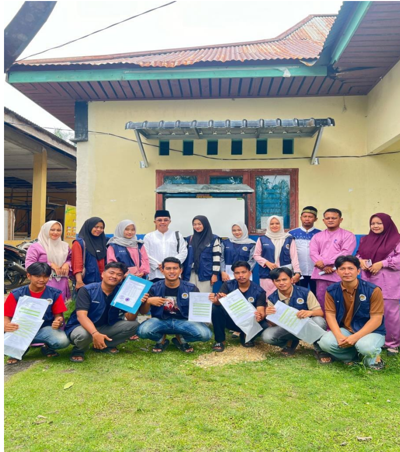
Gambar 5. Serah terima papan informasi kepada pihak desa