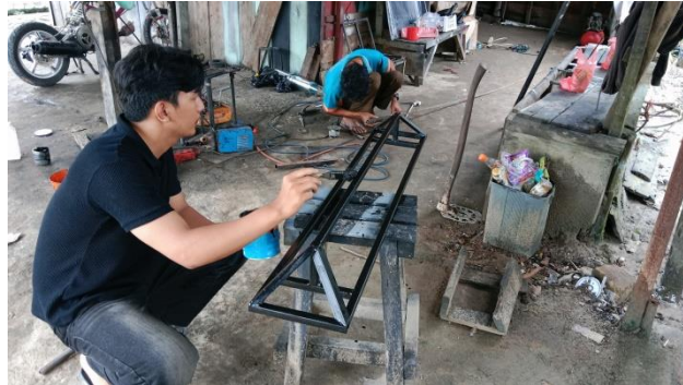
Gambar 1. Perakitan Papan Informasi