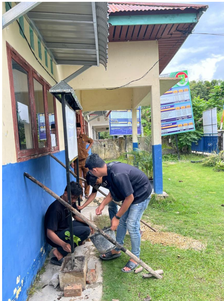
Gambar 2. Pemasangan Papan Informasi